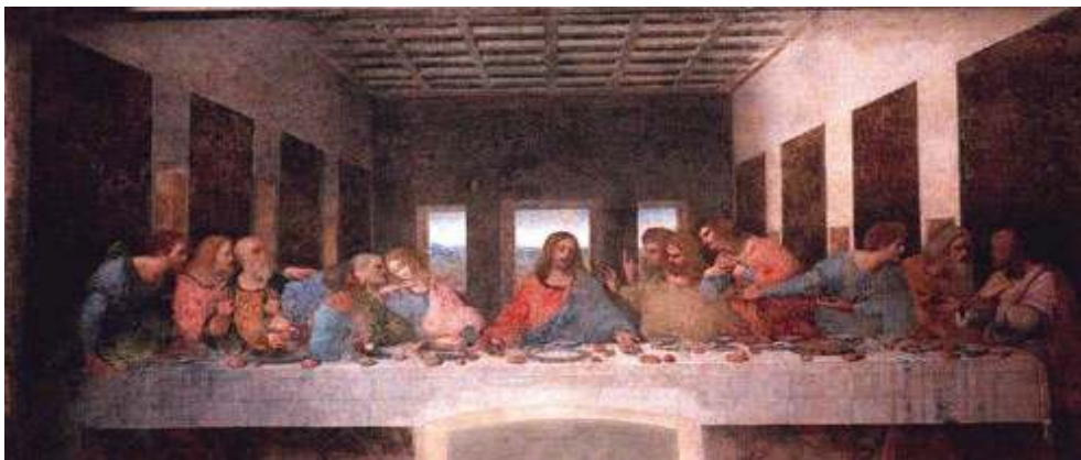
β) Λεονάρντο Ντα Βίντσι, Μιλάνο, τραπεζαρία της Σάντα Μαρία ντελε Γκράτσιε (1494-1497)