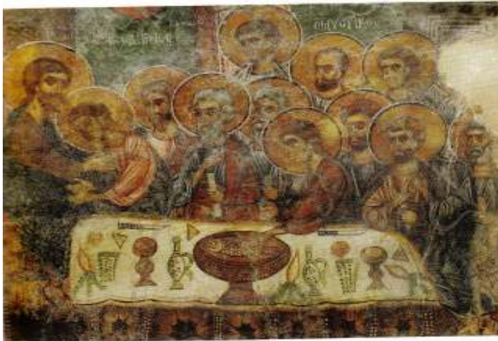
α) Παναγία Κερά Κριτσάς, βόρεια καμάρα μεσαιου κλίτους (β' μισό 13 ου αιώνα)

5. Ας συγκρίνουμε τώρα τις δύο παρακάτω τοιχογραφίες, που ωστόσο απεικονίζουν το ίδιο θέμα, το Μυστικό Δείπνο . Η πρώτη τοιχογραφία είναι βυζαντινής τέχνης , η δεύτερη είναι μεταγενέστερη χρονικά, έργο του Λεονάρντο Ντα Βίντσι. Ποιες διαφορές παρατηρείτε στον τρόπο που ζωγράρισαν οι δυο καλλιτέχνες; Μπορείτε να απομονώσετε τώρα τα χαρακτηριστικά της βυζαντινής τεχνοτροπίας;